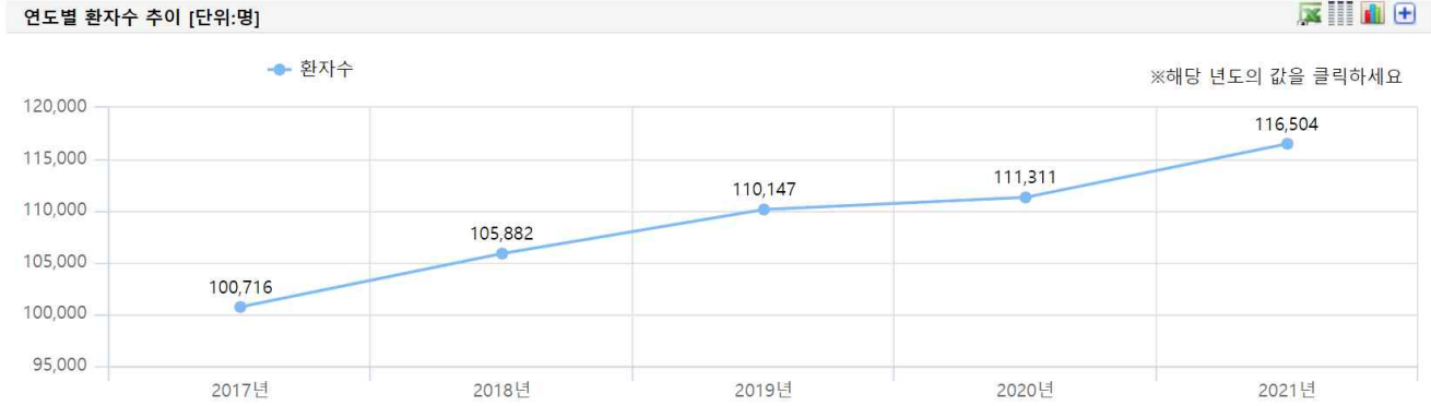
그림 1. 국내 파킨슨병(질병분류기호 G20) 연도별 환자 수 추이(2017~2021년)